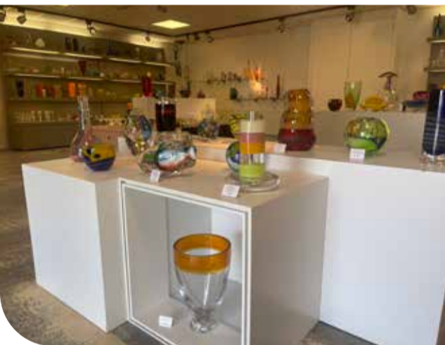
Leerdam Vintage

In zijn winkel zijn naast Leerdams en Scandinavisch glas allerlei vintage en design artikelen te koop. Waaronder aardewerk, keramiek, lampen uit de zestiger jaren, kunst en lp's. Al staat de schitterende collectie van Leerdams glas voorop: variërend van enkele tientjes tot verzamelobjecten van grote waarde.