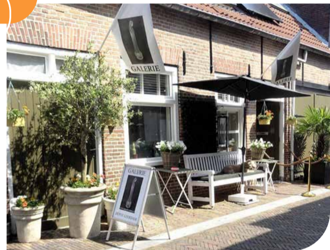
Glasdepot Leerdam

De openingstijden op vrijdag en zaterdag zijn van 10.00 tot 17.00 uur en zondag van 12.00 tot 17.00 uur. ●